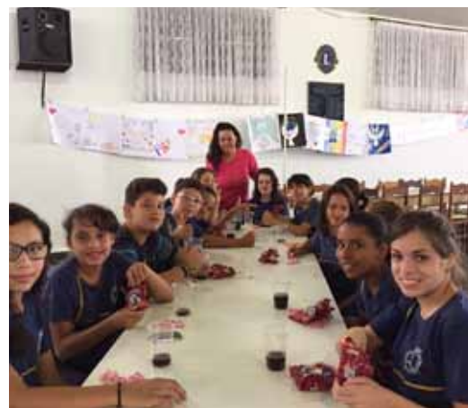
Um lanche foi servido a todos alunos que visitaram a exposição dos cartazes

No dia 28 do corrente os vencedores do concurso foram premiados durante a reunião festiva do clube, cuja matéria está sendo publicada na primeira página desta edição.