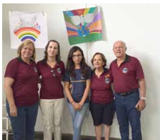
Grupo do Lions que recebeu os pequenos visitantes na nossa sede