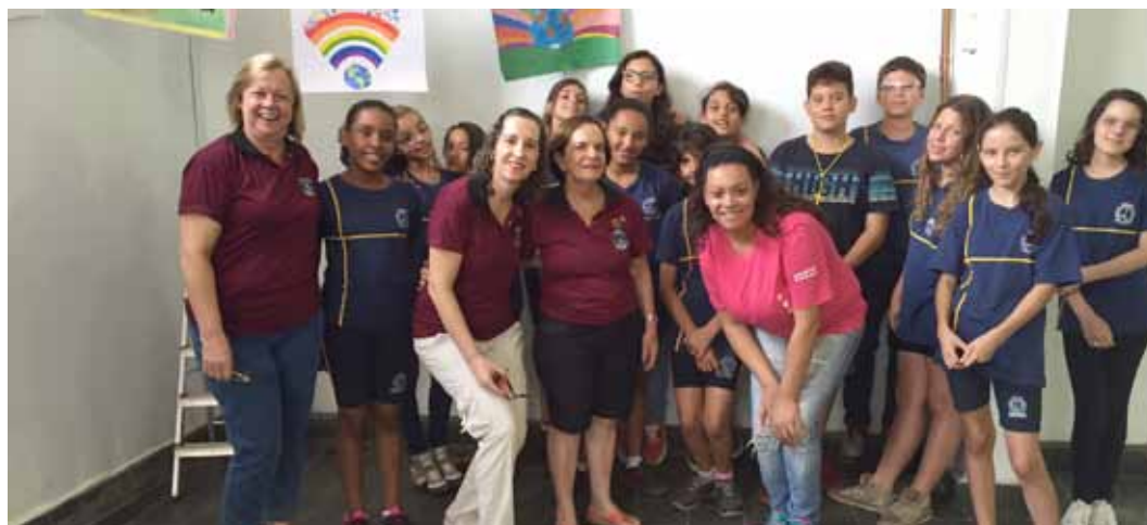
Uma pose dos alunos da EMEF João Maria de Araujo.