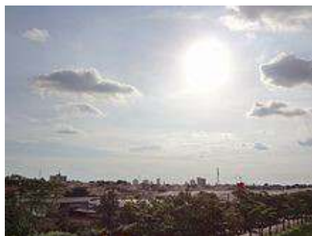
Vista de Mirassol.

Mirassol possuía em 2010, de acordo com o Censo do IBGE, 53 792 habitantes. De acordo com o mesmo Censo, a cidade conta com 52 433 habitantes na zona urbana e 1 359 na zona rural. Com 243,2 km² de área territorial, Mirassol tem uma densidade demográfica de 221,2 habitantes por km².[3] Na Estimativa de 2011 do IBGE, a cidade conta com 54 211 habitantes.