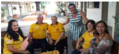
24 de Janeiro 10ª. Capacitação Lions Quest em São José do Rio Preto