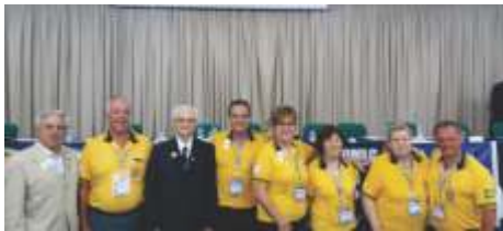
06 de Janeiro Reunião Extraor. do Conselho dos Governadores DMLC - Campinas