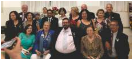
08 de Janeiro Lions Clube de Franca - (todos os Clubes)