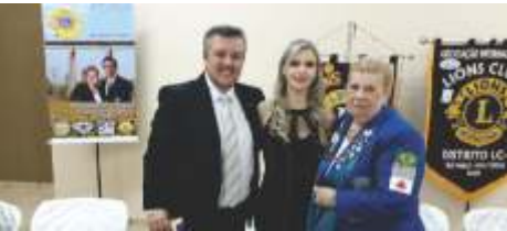
08 de Janeiro Lions Clube de Guariba