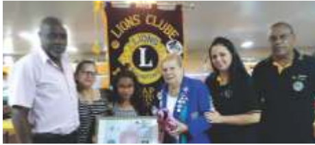
29 de Novembro Lions Clube de Igarapava