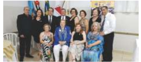
07 de Janeiro Lions Clube de Franca - (todos os Clubes)