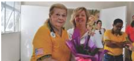
12 de Janeiro Lions Clube de Jaboticabal - Inauguração Maternidade LCIF