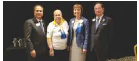
13 de Janeiro FOLAC - em Rosario Argentina