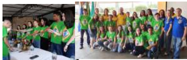
POSSE NOVOS LEOS 13/10/2019