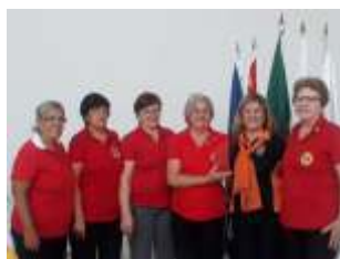
L.C. RIB. PRETO IPIRANGA MAIOR CARAVANA PROPORCIONAL