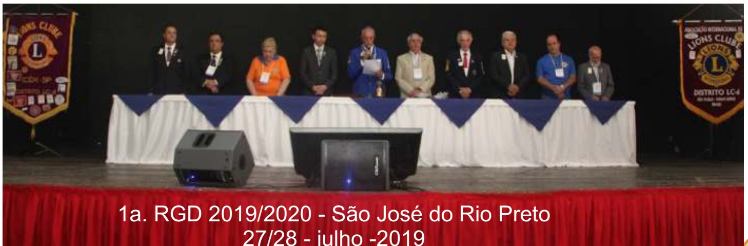
1a. RGD 2019/2020 - São José do Rio Preto 27/28 - julho -2019

2ª Reunião do Conselho Distrital LC 6 Ribeirão Preto - SP 10 de novembro de 2019