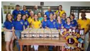
06 DE OUTUBRO 2019