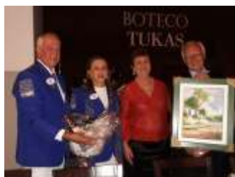
15 DE OUTUBRO 2019