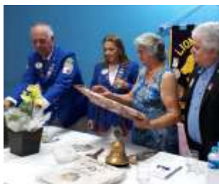
18 de outubro de 2019