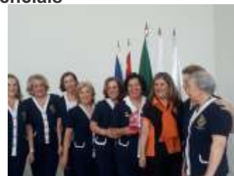
Lions Clube Rib. Preto Centro maior pontuação