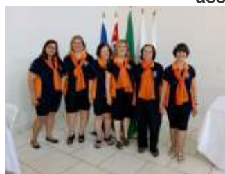
Lions Clube Rib. Preto Jd. Paulista - Organizadoras

Foram arrecadados: Leite longa vida = 1.074 litros - Fraldas descartáveis = 705 unidades. Os produtos arrecadados foram destinados às entidades assistenciais