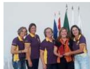
LC SÃO JOAQUIM DA BARRA - CARAVANA MAIS DISTANTE