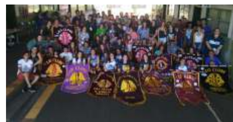
LC ICEM - 26 E 27 / OUTUBRO / 2019