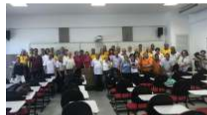
FRANCA - 20/outubro/2019