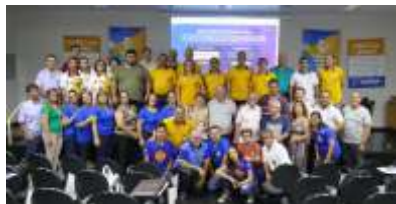
VOTUPORANGA - UNIFEV 05/10/2019