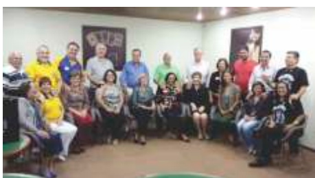
DMLC - 16a Convenção Colegiado Mãos Dadas