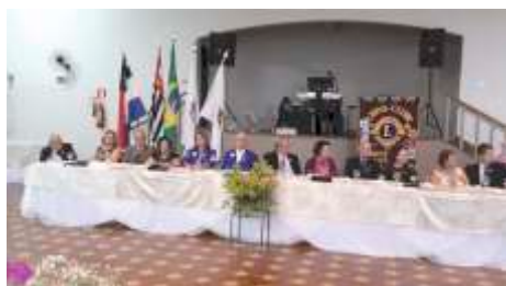
LC de Monte Alto