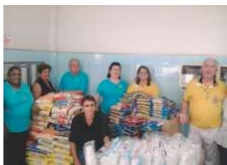
LC de Guaira - Águas Correntes Doação Santa Casa