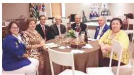
LC de Olimpia