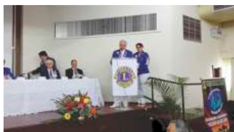
DMLC - 16a Convenção - Governador DLC-6 Prestação de Contas do DLC-6