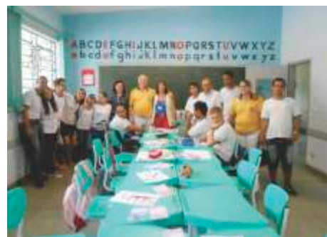
Apae de Jales