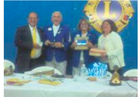
LC São José do Rio Preto Sul