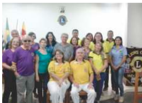
LC de Indiaporá