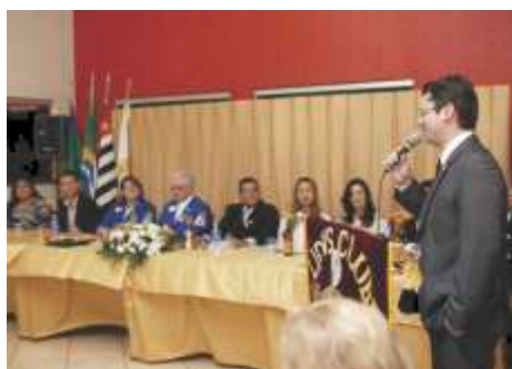
LC de Ouroeste