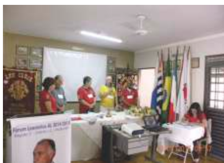
Fórum Leonístico da Região C No LC de Matão