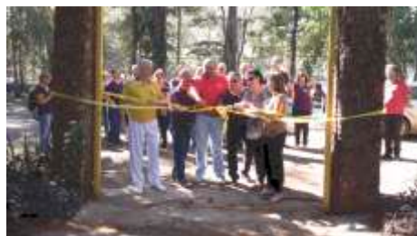
LC de Orlandia - Praça Lions