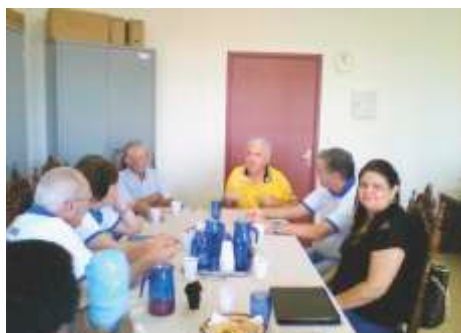
LC de Ituverava Reunião Administrativa