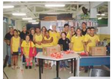
LC de Cravinhos APAE