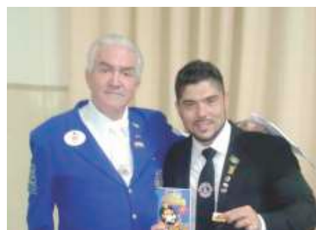
LC de Guaira - Homenagem para o Coordenador de Divisão