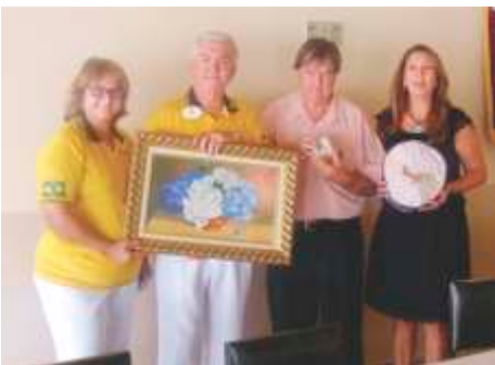
LC de Icem