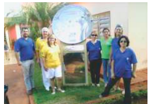
LC de Miguelópolis Asilo das Irmãs Dominicanas Parceria Com O Lions