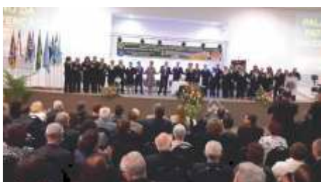
DMLC Abertura da 16a Convenção