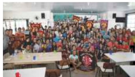
XXVII Conferencia do Distrito Leo - CL-6