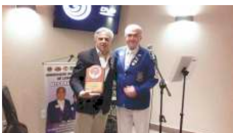
Governador Entrega Premio Para IPCC Bittar - DMLC