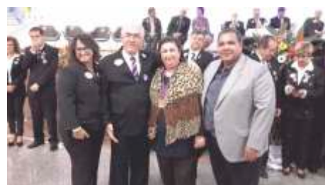
DMLC 16a Convenção Homenagem ao Casal Coordenador do Distrito