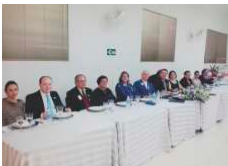
LC de Catanduva