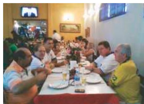
LC de Barretos - Administrativa