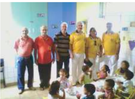
LLCC Rib. Preto Jardim Paulista e Ypiranga