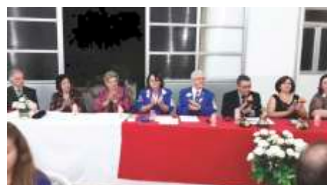
LC de Orlandia