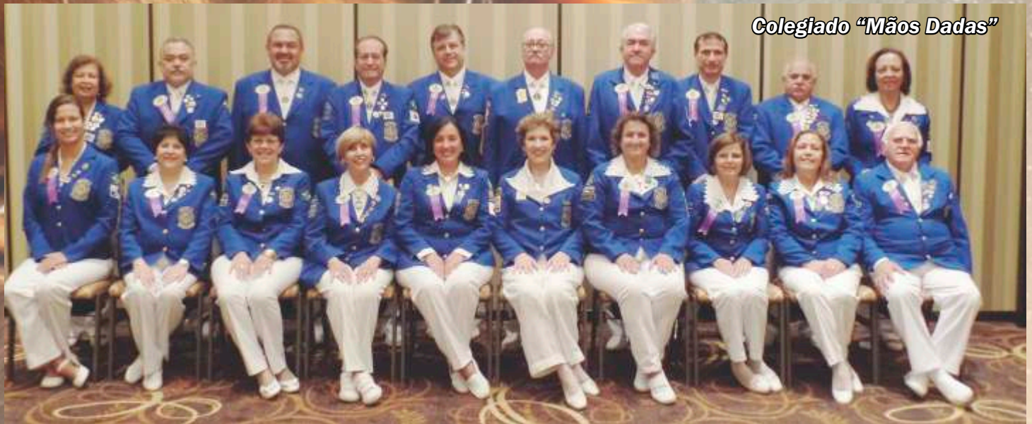
Colegiado "Mãos Dadas"