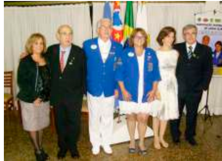
LC Ribeirão Preto Centro