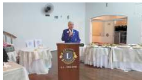
LC de Monte Alto Pronunciamento do Governador