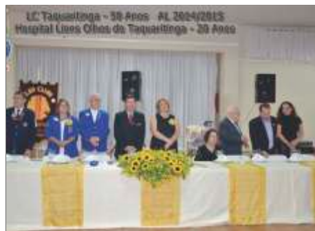
LC de Taquaritinga