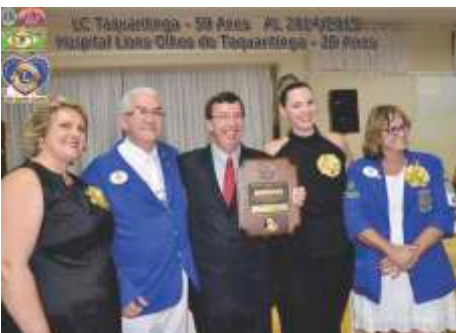
LC de Taquaritinga Entrega de Comendas Casal Presidente