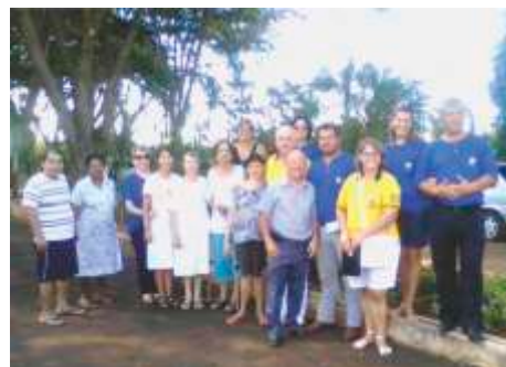
LC de Miguelópolis