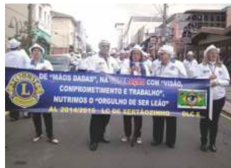
DMLC - 16a Convenção Desfile do Distrito LC-6