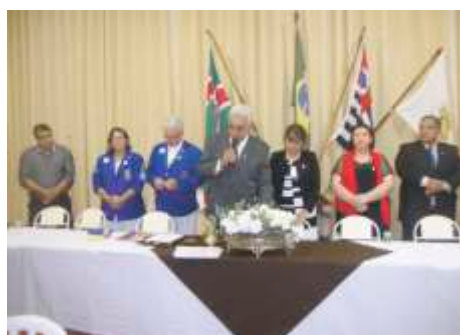
LC de Guaira