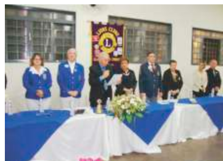
LC de Guaira - Águas Correntes