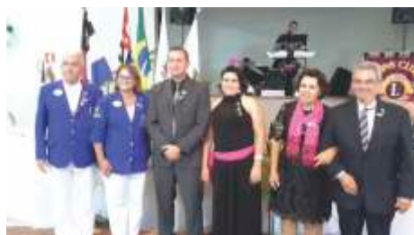
LC de Monte Alto Casal de Novos Associados