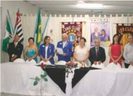
LC Palmeira D'Oeste