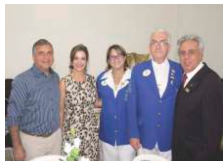
Convenção DLC-6 Orlandia - Civismo