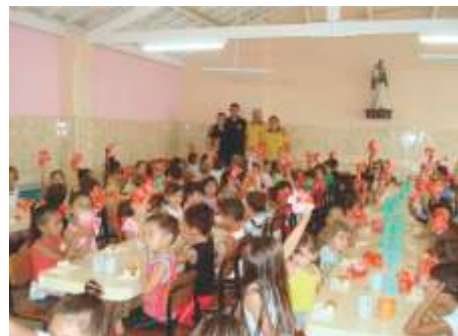
LC de Cravinhos