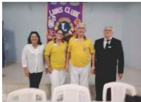
LC de Jales