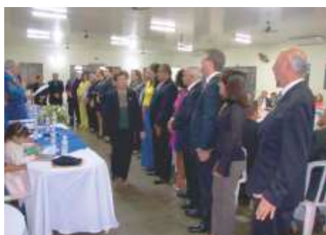
LC de Guaira - Águas Correntes Posse de 13 novos sócios