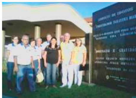
LC de Ituverava Lar dos Idosos mantido pelo Clube