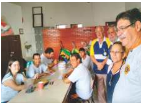
LC São Sebastião do Paraíso