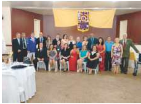
LC Pedregulho Usina Estreito