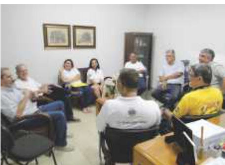
LC São Joaquim da Barra