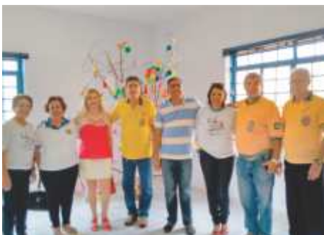
LLCC Franca ( Centro - Cidade Nova - Inovação - Imperador - Sobral)