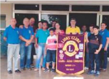
LC Guairá - Águas Correntes