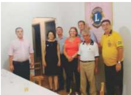
LC São Simão