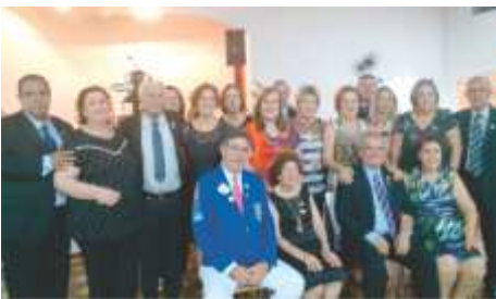
LC Monte Alto