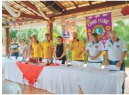
LC Neves Paulista