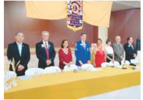
LC Pedregulho Usina Estreito