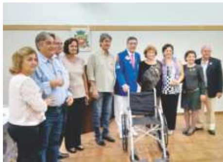
LC Novo Horizonte