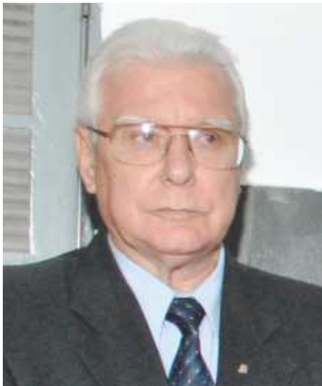
Fevereiro, Mês dos Ex-Governadores

Inicia-se fevereiro e, com ele, registra-se uma das mais notáveis e meritórias efemérides do calendário leonístico: comemora-se o mês consagrado aos nossos Governadores de anos anteriores.