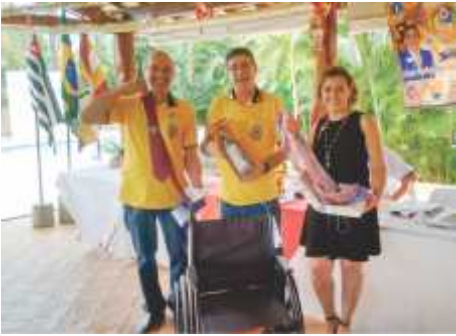
LC Neves Paulista