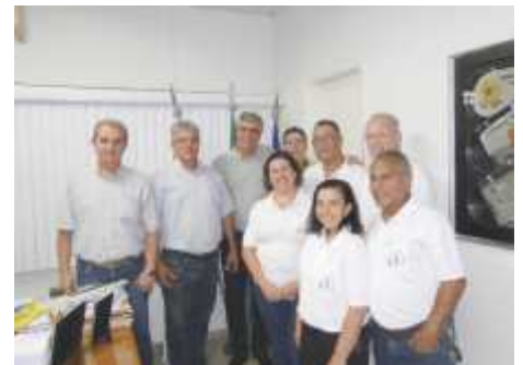
LC São Joaquim da Barra