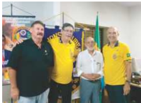
LC José Bonifácio