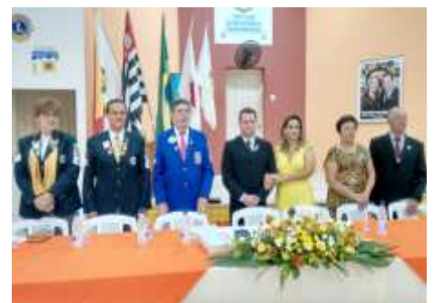
LC Fernandópolis Cidade Progresso