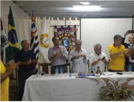
Aniversário Palmeira D'Oeste - 17/03/16