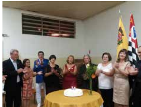
Sertãozinho - 49 Anos - 14/02/16