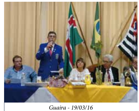
Guaira - 19/03/16