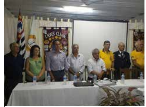
Fórum Leonístico A - 17/03/16