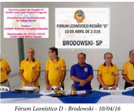
Fórum Leonístico D - Brodowski - 10/04/16