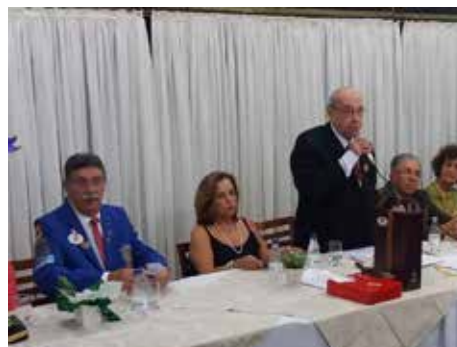
Ribeirão Preto (Centro) - 57 Anos - 18/03/16