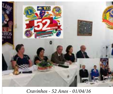
Cravinhos - 52 Anos - 01/04/16