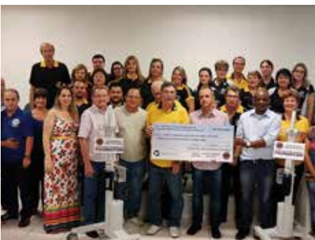
Votuporanga - 26/02/16