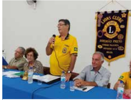
Comitê D3 - 16/02/16