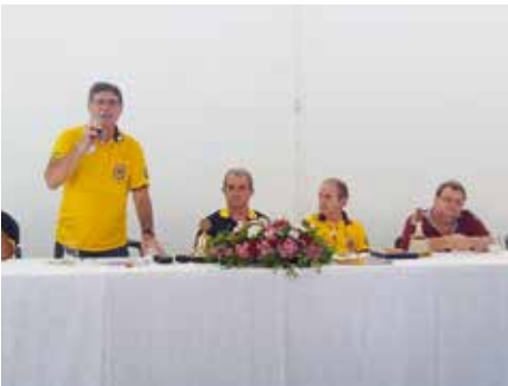
Fórum Leonístico E - 06/03/16