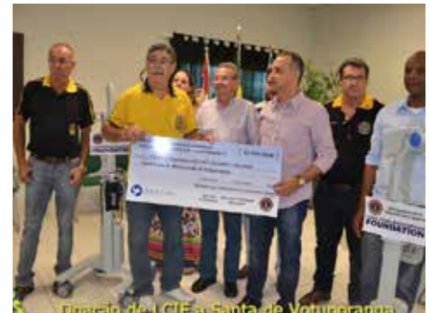
Votuporanga - 26/02/16